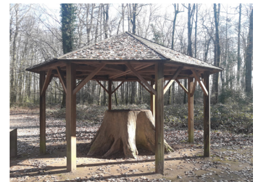
Le Chêne Boppe