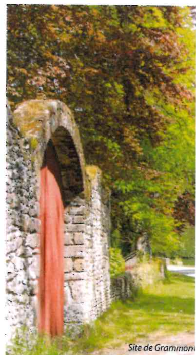
Site de Grammont

En 1163, Henri II Plantagenêt, roi d'Angleterre, fonda sur le site de Grammont un prieuré confié aux moines de l'ordre de Grammont ou Grandmont. Au fil des ans, l'abbaye s'agrandit de façon considérable. L'ordre fut supprimé en 1773 par le pape Clément XIV. Les moines quittèrent la région dès 1778. Les bâtiments subsistants (une ferme, une chapelle et une demeure) sont désormais des propriétés privées.