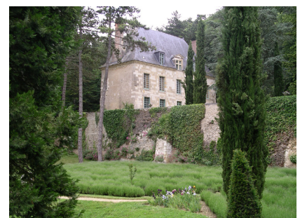
Le château de la Jaille

• Comité départemental de la randonnée pédestre de la Sarthe : 02 52 19 21 35, sarthe@ffrandonnee.fr, www.sarthe.ffrandonnee.fr ou Facebook : FFRandonnée Sarthe.